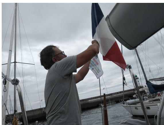
Plaisancier accrochant le fanion de la campagne Ecogestes - marque de son engagement en faveur du milieu marin.

31 bateaux accostés, 114 plaisanciers rencontrés , le bilan de la campagne « Ecogestes Manche Atlantique » déployée dans les ports de Palais et de Sauzon est positif.