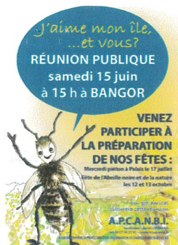
la fête de l'abeille noire et de la nature

• organiser une grande rencontre pour les enfants des collèges et leur famille autour de la biodiversité et de l'Abeille noire.