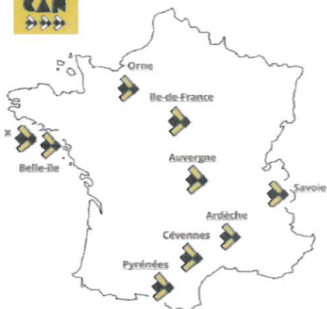
CARTE DES CONSERVATOIRES DE FRANCE